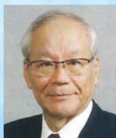
横倉義武共同代表