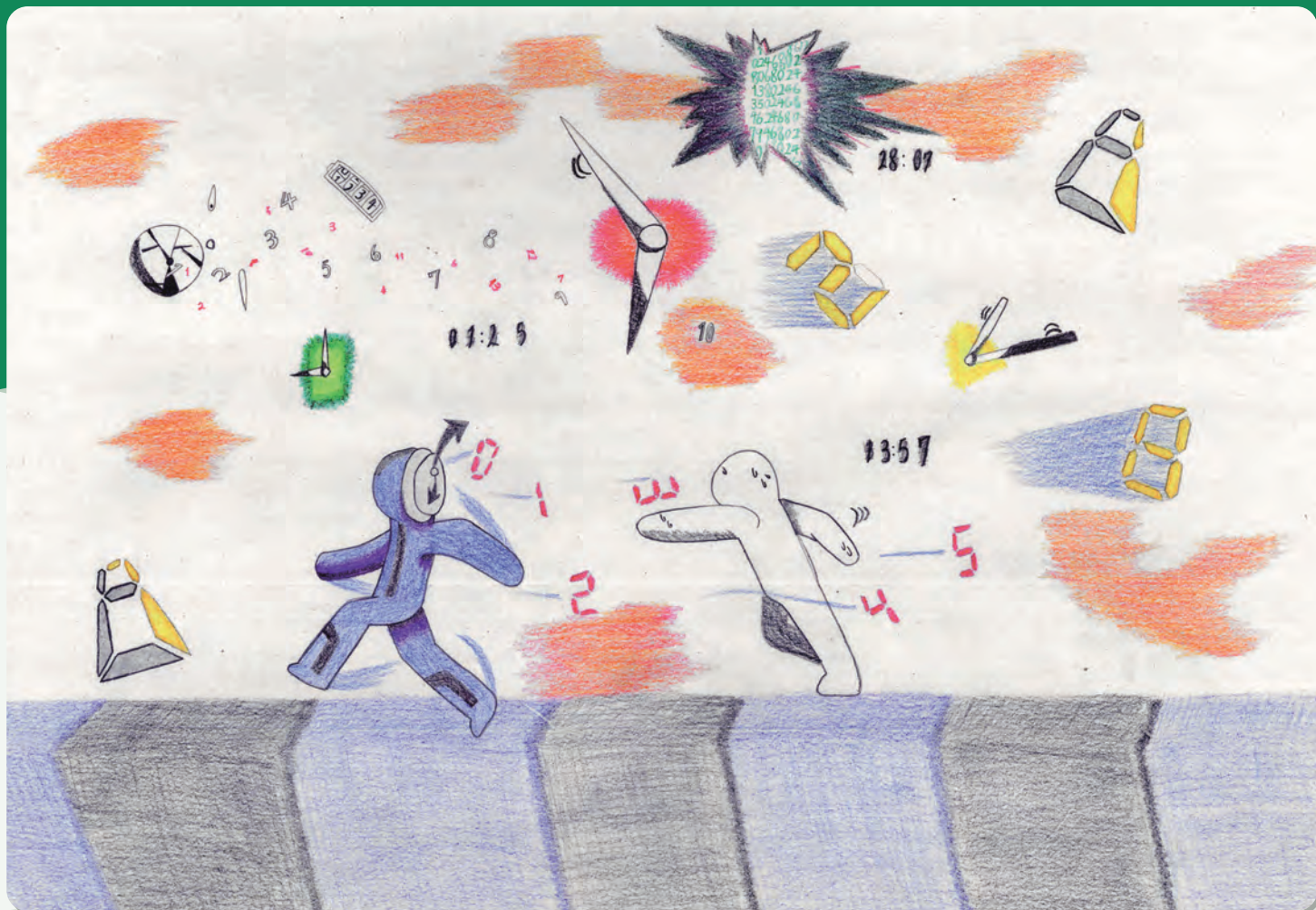
濱 大生 作「時間に追われる人」